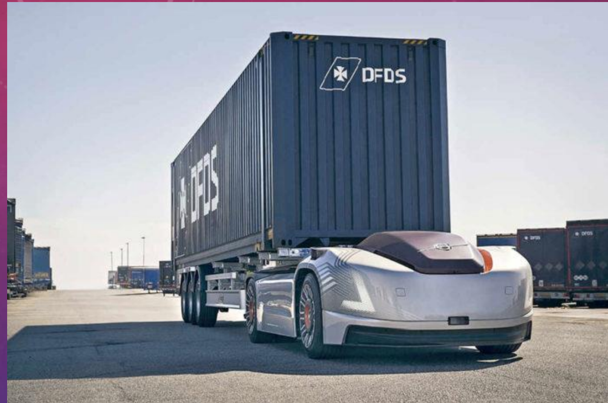
Volvo self-driving truck 'Vera'

Control de accesos, peajes, túneles: SICE