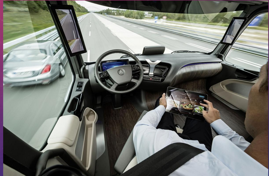
Mercedes-Benz Future Truck 2025 cockpit